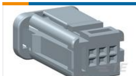
TE 产品编号2208338-1 6POS,NANOMQS,REC HSG,CODA