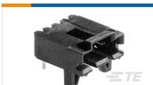
TE 产品编号6-103673-9 20 MTE HDR SRRA LATCH W/HLDWN