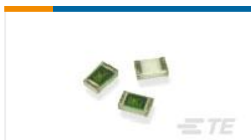
TE 产品编号1676429-2 RN 0805 768R 0.1% 10PPM 1KRL