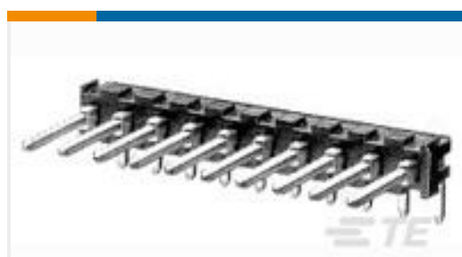
TE 产品编号87232-2 02 MODII HDR SRRA UNSHRD .100