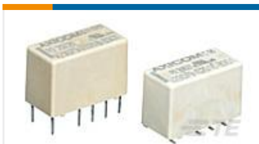
TE 产品编号5-1393789-1 V23079G2003B301