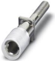
测试孔式连接器，颜色: 白色

Please be informed that the data shown in this PDF Document is generated from our Online Catalog. Please find the complete data in the user's documentation. Our General Terms of Use for Downloads are valid ( http://download.phoenixcontact.com )