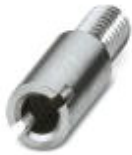
测试孔式连接器，颜色: 银色