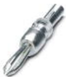
，额定电压(III/2): ，额定电流 ( Ex ): ，额定电压 ( Ex ): ，位数: 1 ，针距: 5 mm ， : ，安装: ，