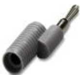
转换桥接件，颜色: 灰色