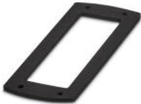
扁平垫片 NBR材质，尺寸B24

Please be informed that the data shown in this PDF Document is generated from our Online Catalog. Please find the complete data in the user's documentation. Our General Terms of Use for Downloads are valid ( http://download.phoenixcontact.com )