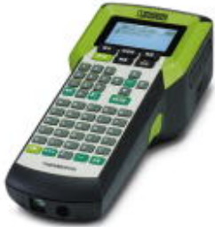
移动式热转印打印机用于卷式材料，该型号配有中文固件和中文键盘

Please be informed that the data shown in this PDF Document is generated from our Online Catalog. Please find the complete data in the user's documentation. Our General Terms of Use for Downloads are valid ( http://download.phoenixcontact.com )