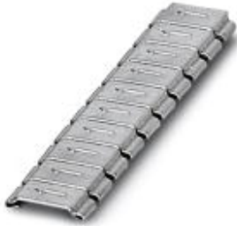
标识套筒，标记带编码：数字，银色，宽度: 5.5 mm

Please be informed that the data shown in this PDF Document is generated from our Online Catalog. Please find the complete data in the user's documentation. Our General Terms of Use for Downloads are valid ( http://download.phoenixcontact.com )