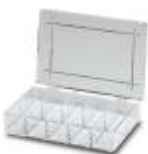
分类箱，尺寸：170 x 105 x 32 mm，10个隔间，隔间尺寸：50 x 32 mm