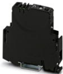
电子断路器，1个复位输入，额定电流：4 A

Please be informed that the data shown in this PDF Document is generated from our Online Catalog. Please find the complete data in the user's documentation. Our General Terms of Use for Downloads are valid ( http://download.phoenixcontact.com )