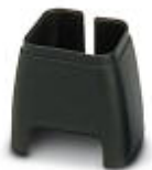
尾缆采用彩色标识，黑色