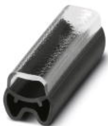
线缆标记条支架，透明/黑色，未标记，安装类型：滑动插接，电缆直径：1.3 - 2.8 mm，标记区域大小：4 x 15 mm

Please be informed that the data shown in this PDF Document is generated from our Online Catalog. Please find the complete data in the user's documentation. Our General Terms of Use for Downloads are valid ( http://download.phoenixcontact.com )