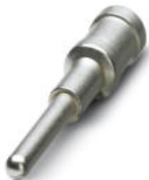
车削压接插针，插针直径2.5，针式插针，接线容量4.00 mm 2 ，镀银

Please be informed that the data shown in this PDF Document is generated from our Online Catalog. Please find the complete data in the user's documentation. Our General Terms of Use for Downloads are valid ( http://download.phoenixcontact.com )