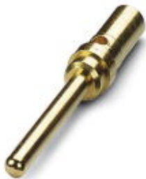
D-SUB压接插针，接线方式: 压接，接线容量: AWG 28- 26

Please be informed that the data shown in this PDF Document is generated from our Online Catalog. Please find the complete data in the user's documentation. Our General Terms of Use for Downloads are valid ( http://download.phoenixcontact.com )