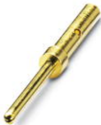
D-SUB压接插针，接线方式: 压接，接线容量: AWG 28- 22，High Density

Please be informed that the data shown in this PDF Document is generated from our Online Catalog. Please find the complete data in the user's documentation. Our General Terms of Use for Downloads are valid ( http://download.phoenixcontact.com )