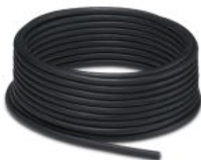
电缆, PVC, 黑色, 3芯, 颜色: 棕色/蓝色/黑色, 长度: 100 m

Please be informed that the data shown in this PDF Document is generated from our Online Catalog. Please find the complete data in the user's documentation. Our General Terms of Use for Downloads are valid ( http://download.phoenixcontact.com )